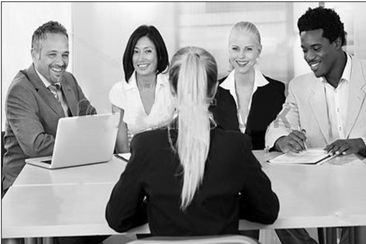
[Xifaniso lexi xi huma eka Magazini ya TRUE LOVE ya Hukuri 2014/No. 429 Can Stock Photo – CS15423766]