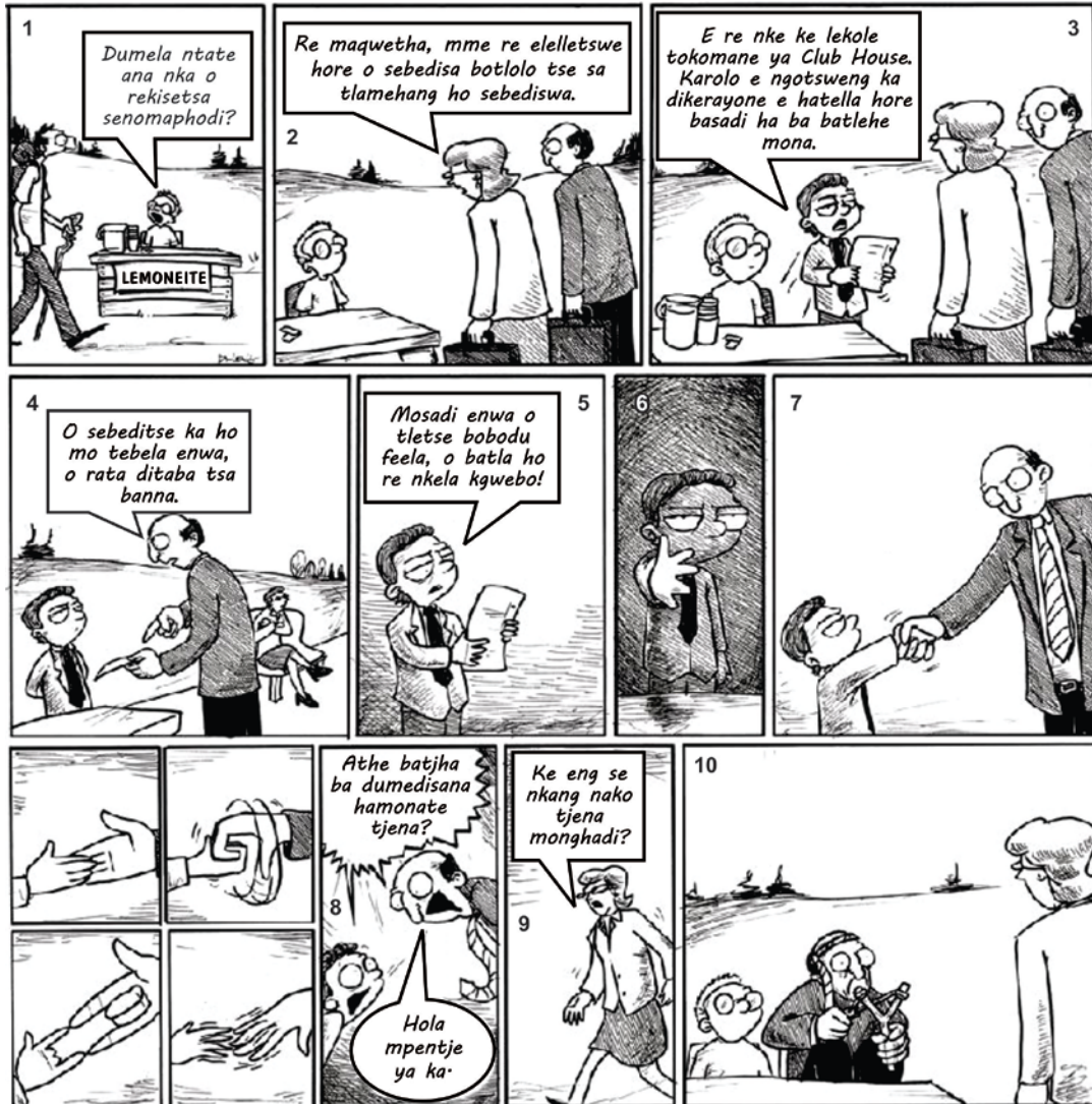
[© 2011 Dan Lang/<EQComics.com>]