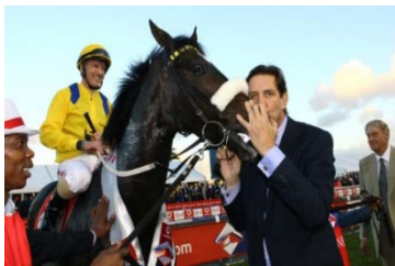
MOKATO WA DIPERE