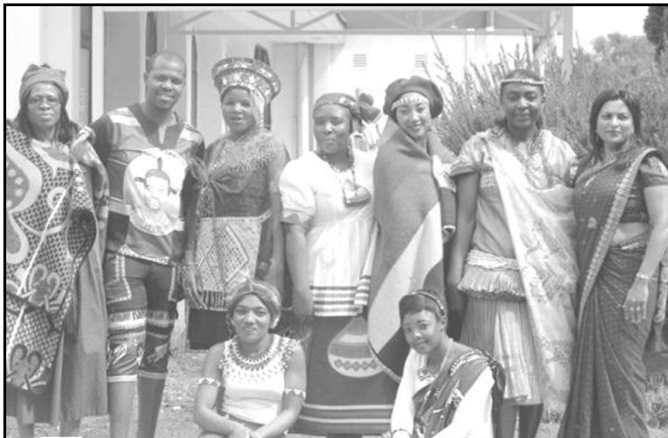
Re ikgantšha ka setšo sa rena.

[E amantšwe go tšwa go inthanete: Heritage]