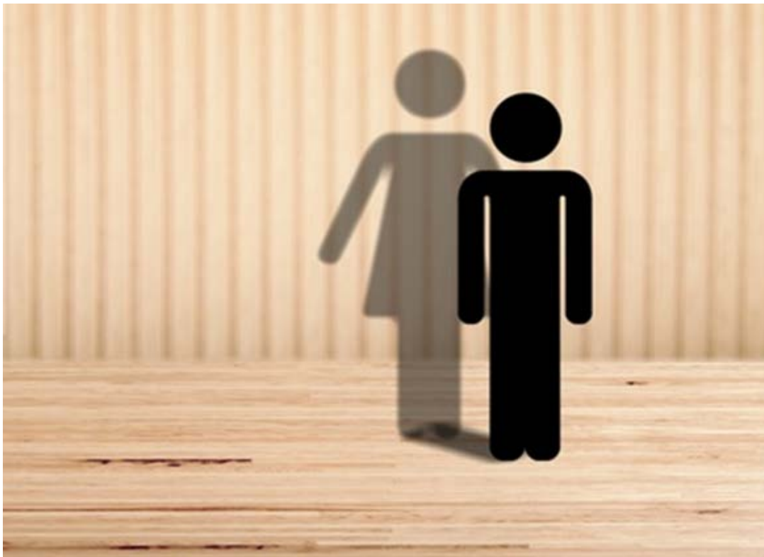
[Image : < https://encrypted-tbn0.gstatic.com/images?q=tbn:ANd9GcS2DUUIwz4UvrX7JEH124gp7qSW-iRyh4f6O08PLPr4COsINx3B >]