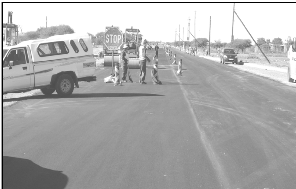
[Semphete, 20 May 2016]

O mogakolodi wa mokhanselara wa motse mme o go kopile go tlhokomela gore setheo se se dirang tsela mo motseng wa lona se dira tiro e e duleng diatla. Kwala potsotherisano e o nnileng le yona le motsamaisi wa setheo seo kwa tshimologong ya tiro.