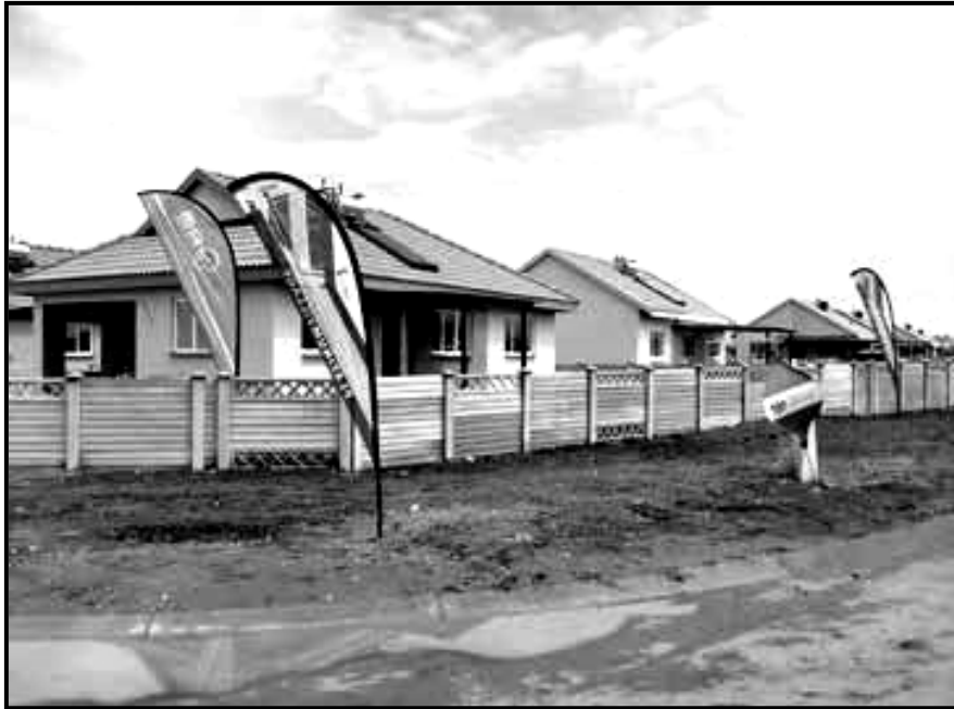
[BUA MOAGI, Tlhagiso ya 4, 2016]

O dira ka go rekisa matlo, mme go nnile le diphoso mo matlong a lo a rekisitseng ngogola. O kopilwe ke setheo sa lona go dira dipatlisiso ka ga diphoso tseo le seemo sa matlo ao. Kwala pegelo ka ga dipatlisiso tseo. Gakologelwa go tlhagisa diphithhelelo le dikatlanegiso.