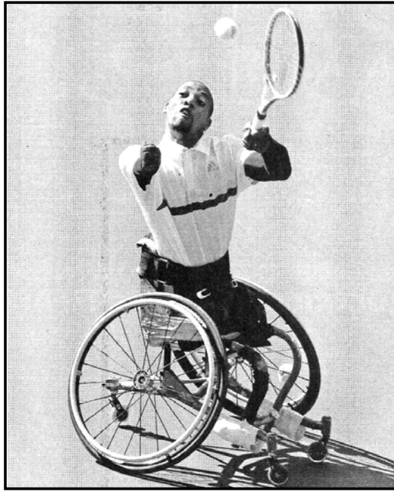
[City Press, 4 Lwetse 2016]