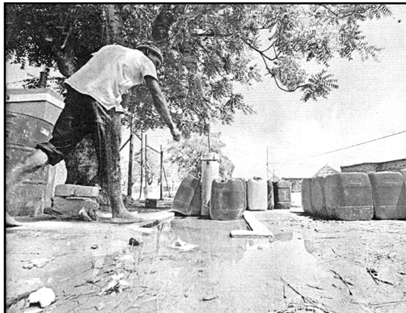
[City Press, 5 Seetebosigo 2016]