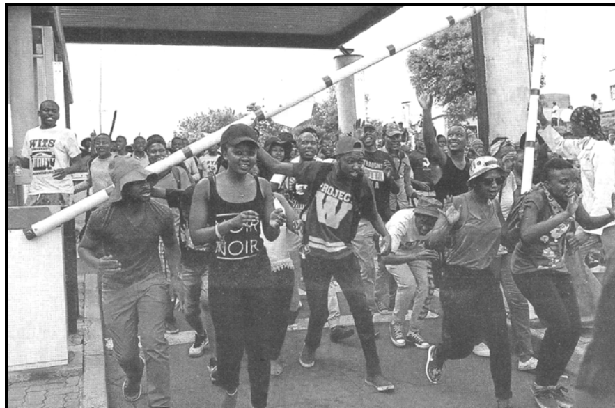
[Se nopotswe go tswa mo: The Times , Labobedi, 20 Diphilane 2015]